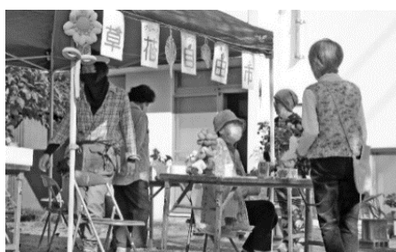
▲ 2022年の草花自由市の様子