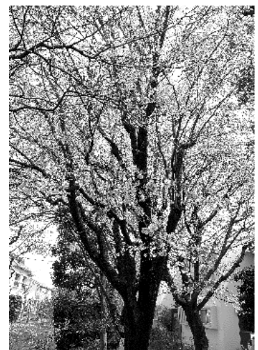
▲ 団地内のサクラの開花状況をいち早く確認できるのも活動の喜びです