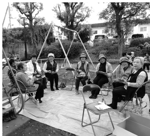
▲しばらくなかった交流の場に、参加者の皆さんの笑顔がこぼれます

当日は開始直後にぱらぱらと雨に見舞われましたが、会場に選んだ南ブロックのプレイロットには25名の方がお集まりになり、春の花々がまさに彩りを添える中、ここ数年疎かにならざるを得なかった対面での交流で賑わいました。