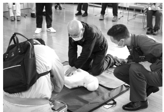
▲AED(自動体外式除細動器)による応急救護訓練

最初に家具転倒防止についての講話があり、次いで救命救急訓練としてAEDの操作訓練を行いました。以前は当たり前だった人工呼吸も新型コロナの流行下では行なわ