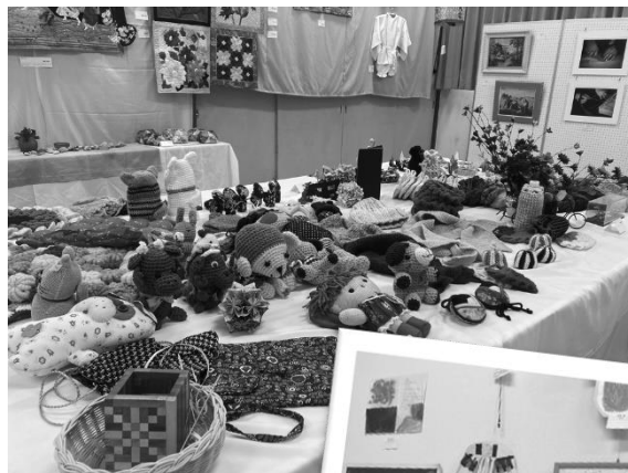
▲展示台に所狭しと並べられた作品の数々

洋室（大）には40名の方々の作品が並び、展示作品を見るだけでなく、「譲って欲しい、教えてほしい、集まりに参加したい」等の声上がり、新たな交流も生まれていました。一画に設けたキッズコーナーには、夏まつりで人気を博したバルーンアートのプレゼントがあったおかげで子どもたちの出展数も多く、会場の賑わいが一層増していました。