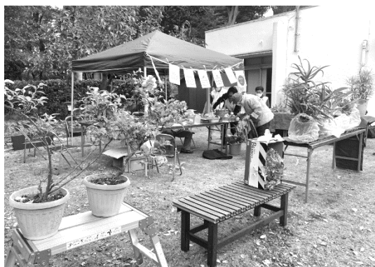
▲賑わいの草花自由市

11日には、中庭で植栽委員会主催の草花自由市が行われ、鉢植え、種、鉢等が出品されました。集会所の庭で採れた大量の本柚子やしし柚子が提供され、それを使った柚子ジャムのレシピも配布され、両手に柚子を抱えながらのおしゃべりで盛り上がっていました。また午後からは、洋室（小）で西都保険生協実施による健康チェックコーナーが開催され、骨密度測定や看護師さんのアドバイスも受けられました。