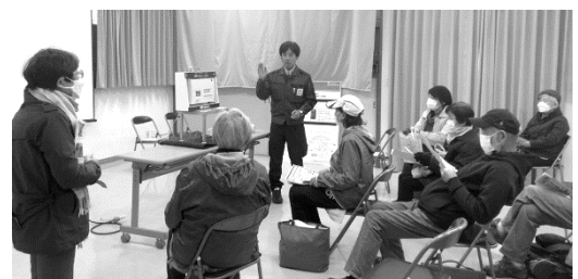
▲デモ機を用いての説明に熱心に聞き入る参加者の皆さん

なお、当日配布されたパンフレットの一部分は管理事務所にあります。関心のある方はお持ちください。