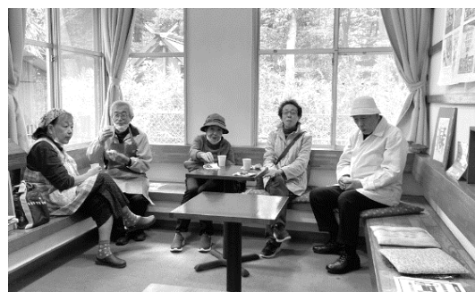
▲談笑の絶えない喫茶コーナー。コーヒーとお手製のマドレーヌ、落花生も振舞われました