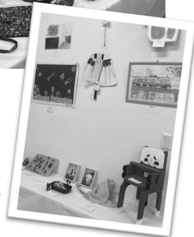
▶お絵描きあり、工作ありのキッズコーナー